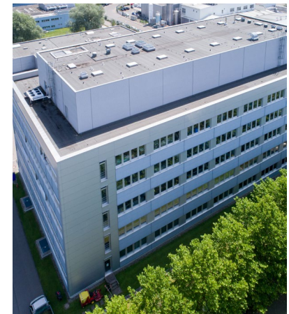
exemplarische Fotos der Mietfläche