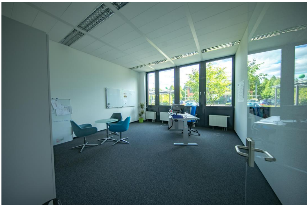
Beispiel eingerichtete Mietfläche