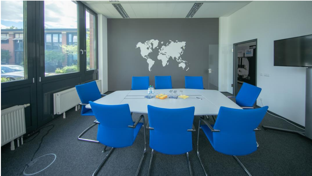
Beispiel eingerichtete Mietfläche